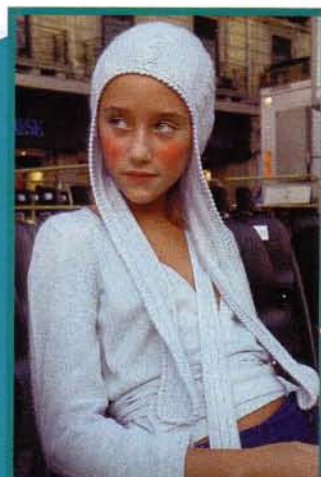
Un modello della collezione Giacomondo autunno/inverno

L'azienda ha inoltre instaurato dei contatti con la produzione RAI della fiction Incantesimo dove due dei piccoli attori vestono le collezioni Giacomondo della primavera-estate 2005 e dell'autunno- inverno 2005-06. Il brand sponsorizzerà pure la rappresentazione teatrale del prossimo novembre "Storia incredibile di due principesse" e la festa finale a chiusura della rassegna di incontri dedicati ai bambini e alla famiglia organizzata dalla Duchessa di York Sarah Ferguson in collaborazione con Mondadori Multicenter.